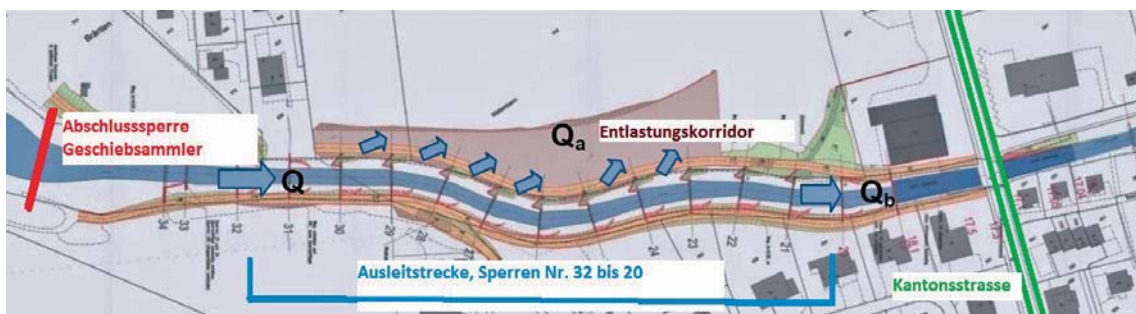
Bild 2. Ausleitstrecke gemäss Hochwasserschutzprojekt. Q = Abfluss oberhalb der Ausleitstrecke, Q a = Ausleitwassermenge und Q b = Abfluss unterhalb der Ausleitstrecke.