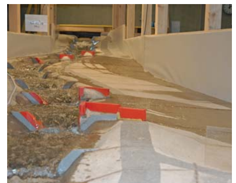
Bild 6. Beginn der Ausleitung bei den Sperren Nr. 22 und Nr. 23 (Vordergrund) sowie Nr. 27 und Nr. 28 (Hintergrund) im hydraulischen Modellversuch beim Dimensionierungsabfluss von 60 m 3 /s. Blick bachaufwärts.