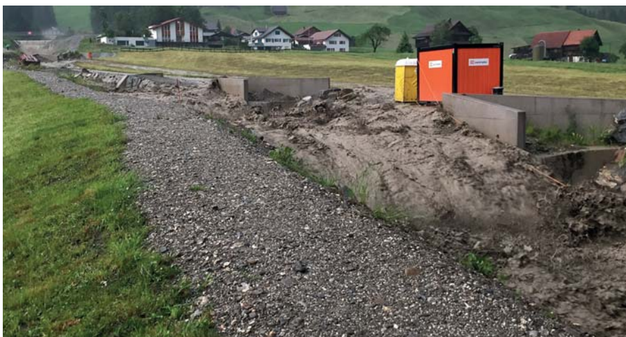
Bild 5. Ausleitung im Höchststand bei den Sperren Nr. 22 und Nr. 23. Blick vom rechten Ufer bachaufwärts.