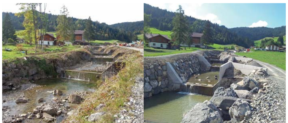
Bild 1. Ausleitstrecke mit klassischen Betonsperren vor dem Umbau (links) und nach der Fertigstellung mit erhöhten Flügeln, verengten Überfallsektionen und Ausleitsporen (rechts).

Im Rahmen der Projektierung mussten die hydraulischen Nachweise für die Ausleitung geführt werden. Ein erstes, approximatives Design der Ausleitstrecke im Vorprojekt wurde mithilfe ein- und zweidimensionaler numerischer Modellierungen ausgearbeitet. Trotz vielversprechender Resultate bestanden durchaus Zweifel daran, ob eine laterale Entlastung im Steilbereich und auf einer Sperrenstrecke überhaupt