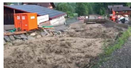
Bild 3. Abfluss bei der Kantonsstrassenbrücke am 24.6.16 (Video: Wuhrkorporation Nidlaubach).

Es lagerte sich eine erhebliche Menge Schwemmholz im Holzrechen ab. Der Rechen funktionierte sehr gut. Es wurde kein Holz ausgetragen, und das Holz wurde wie angestrebt vom Geschiebe separiert. Die